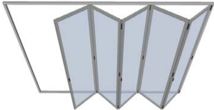
Sistema en posición de ventilación | Natural ventilation option