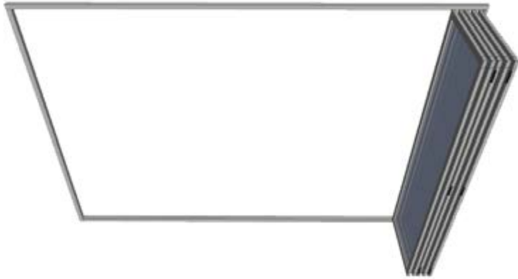
Sistema completamente abierto | Completely opened system