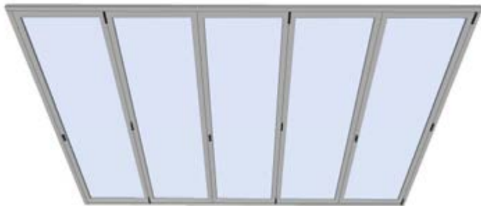
Sistema completamente cerrado | Completely closed system